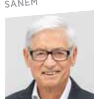
MARTIN KOX ESCH/ALZETTE