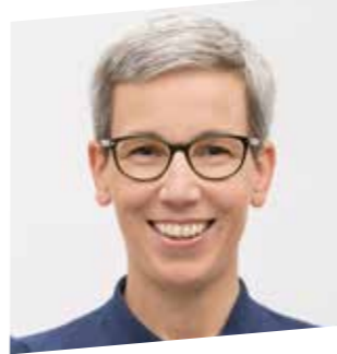
SAM TANSON LUXEMBOURG