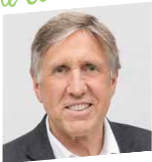
FRANÇOIS BAUSCH LUXEMBOURG