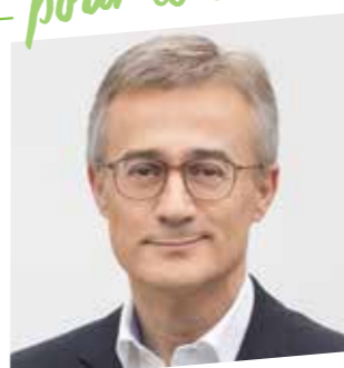
FELIX BRAZ ESCH/ALZETTE